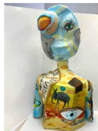
Даница Чоп, 7.разред