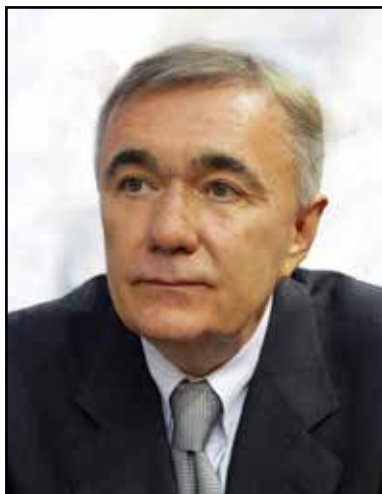
Душан Ковачевић (Мрђеновац код Шапца, 1948)

Српски драмски писац, сценариста, филмски редитељ и академик. Дипломирао је драматургију на Академији за позориште, филм, радио и телевизију у Београду.