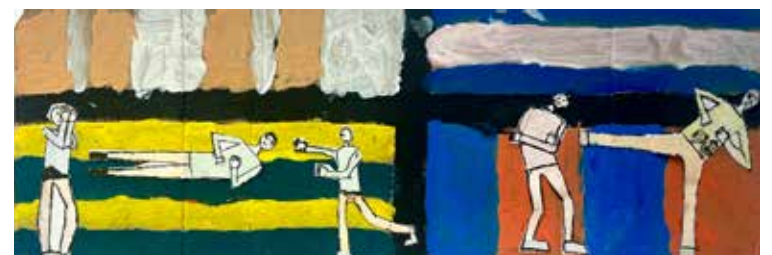
Лука Стефановић, 6.разред