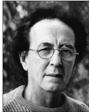
Александар Поповић (1929–1996)

Рођен је у угледној грађанској породици, родом са Уба. Основну школу и Трећу мушку гимназију завршио је у Београду. Оженивши се као