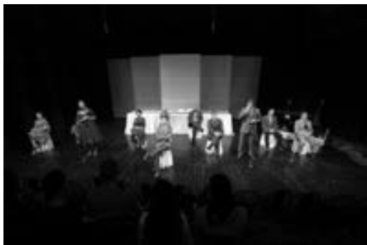
6 (652) Jelenet a darabból