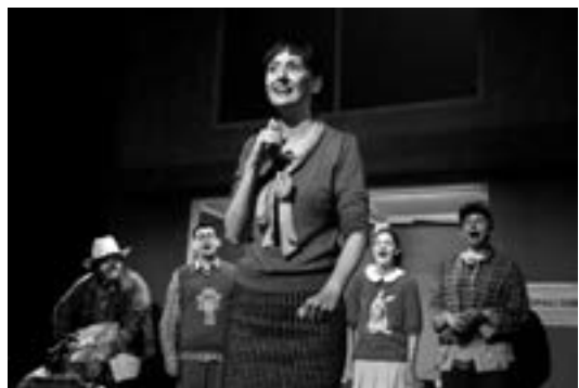
4 (67) Сцена из предсјаве