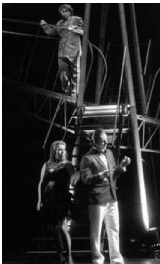
27 (546) Сцена из предсјаве