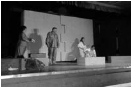
2 (577) Сцена зоз предсїави

4 (3: Ђурђево – 1, Кула – 1, Врбас – 1) 550