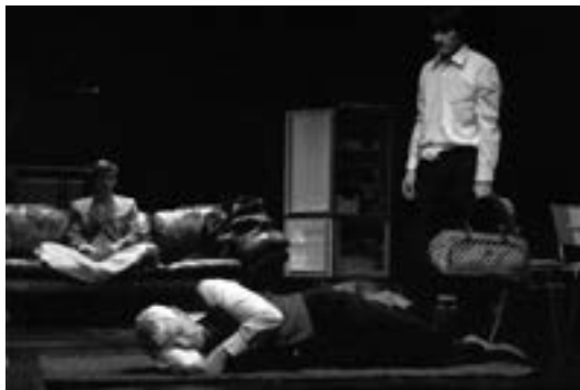
1 (1) Сцена из предсјаве

Артур МИЛЕР: СМРТ ТРГОВАЧКОГ ПУТНИКА (Arthur Miller: Death of a salesman)