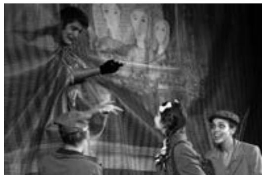
1 (611) Сцена из прегсѿаиве

Прем. 01. 09. 2012, Суботица 14 (-) 1635