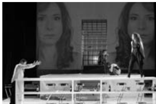
4 (523) Сцена из предсјае

*Копродукција Српско народно позориште, Нови Сад – Народно позориште, Сомбор