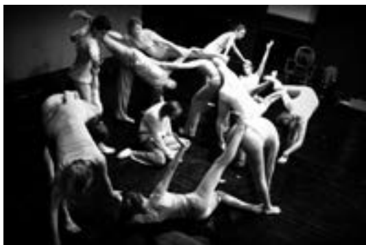
7 (466) Jelenet a darabból