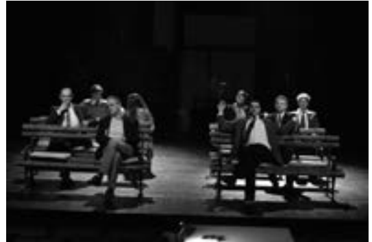
4 (42) Сцена из пресџае

(Федор Михайлович Достоевский: Преступление и наказание)