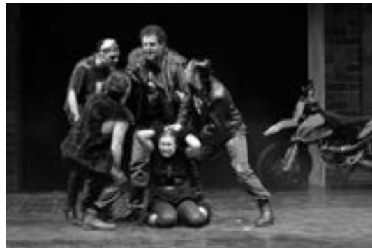
8 (654) Jelenet a darabból