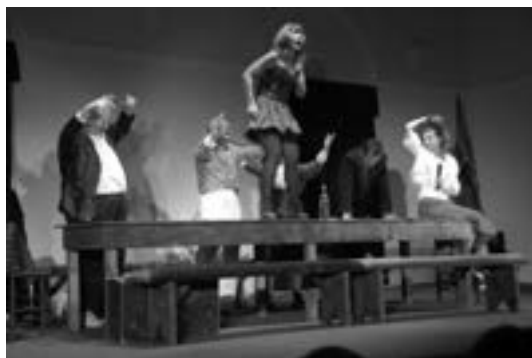
1 (704) Сцена из прегсѿаве

Прем. 20. 10. 2012, Врање 8 (1: Београд – 1) 1528