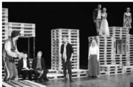
2 (521) Сцена из предсјааве

Пв. дм. Бранко ДИМИТРИЈЕВИЋ, рд. Борис ЛИЈЕШЕВИЋ, дм. Федор ШИЛИ, сц. Горчин